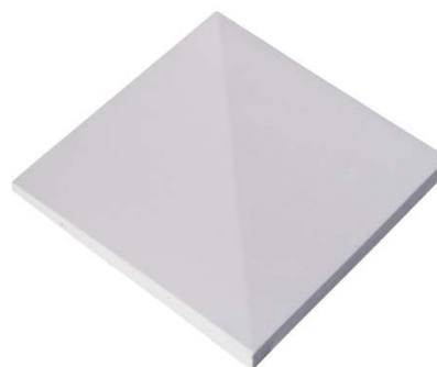
Fotografia da Peça